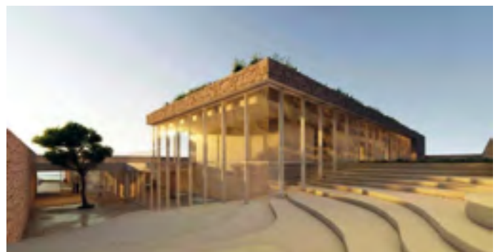
Projection de la future école de Lumio