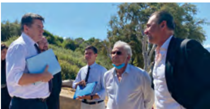
Visite du chantier par le Préfet de Haute-Corse le 8 juillet 2020

La structure devrait ouvrir ses portes pour la rentrée 2022.